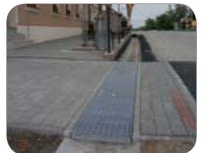
čisté, profesionálne riešenie