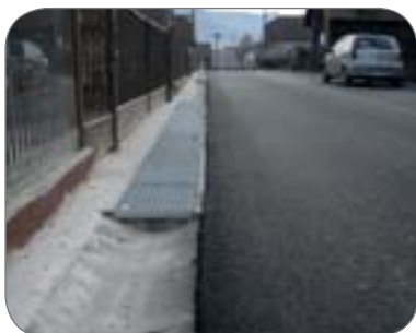
s roštom triedy B