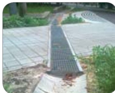
hodí sa ku každému povrchu